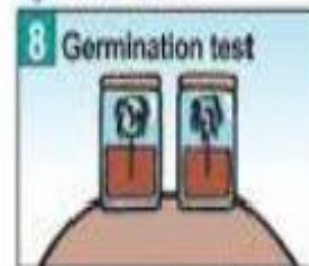
Thử độ nảy mầm để bảo đảm đất đã thoát hết hơi thuốc.