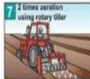
Sau 5-7 ngày dỡ màng phủ và xới đất cho hơi thuốc thoát ra, thoáng khí.