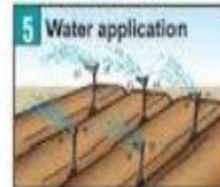
Tưới nước đủ ẩm để thuốc ngấm vào đất.