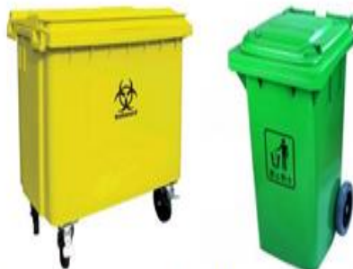
a. Thùng rác 2 - 4 bánh, thể tích 80 - 660 lít