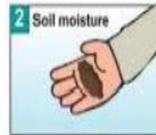
Xác định đất đủ ẩm