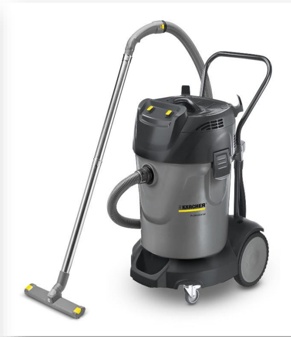
Máy hút bụi công nghiệp