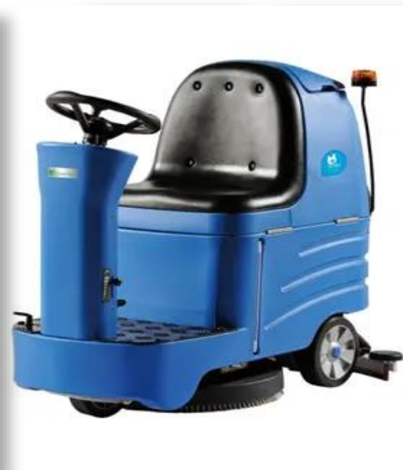
Máy lau sàn công nghiệp