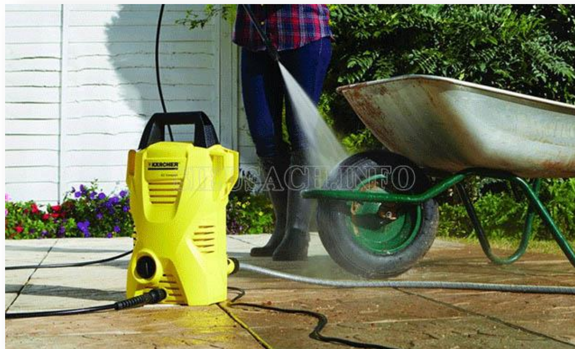
Máy xịt rửa áp lực cao