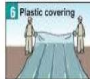
Tiến hành phủ màng phủ.