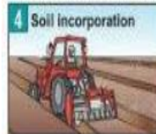
Trộn đều thuốc vào trong đất