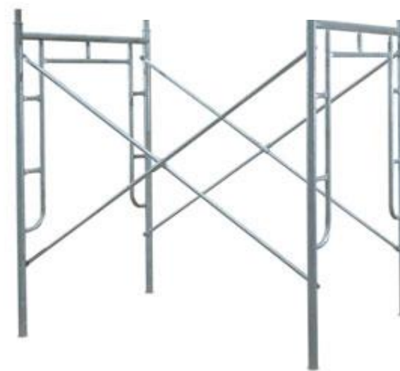
Dụng cụ hỗ trợ trèo cao