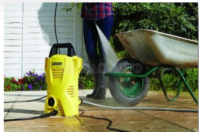
Máy xịt rửa áp lực cao