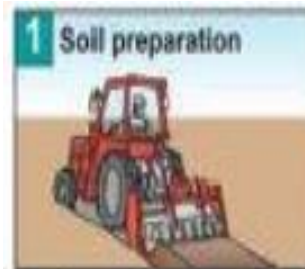
Chuẩn bị đất trước khi trồng

- Khử trùng đất bằng thuốc khử trùng đất Basamid Granular 97MG