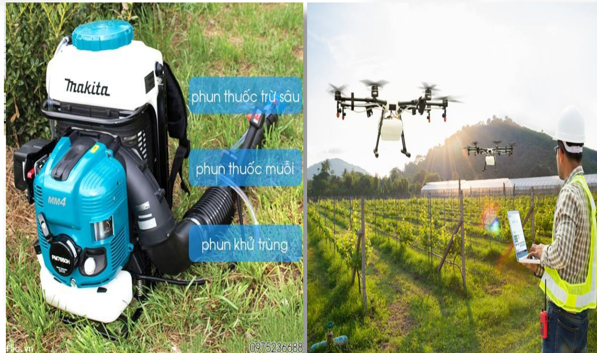
Máy khử trùng