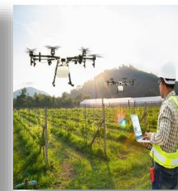
Máy khử trùng