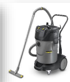
Máy hút bụi công nghiệp