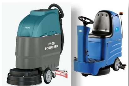
Máy lau sàn công nghiệp