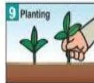
Tiến hành gieo trồng.