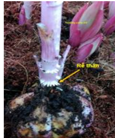
Củ hoa lily mọc rễ thân