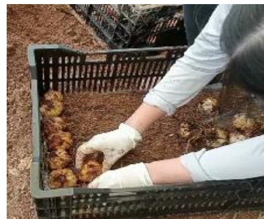
Xếp củ giống