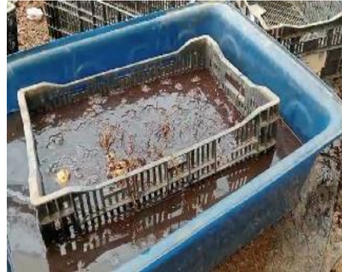
b. Xử lý củ giống với thuốc diệt nấm