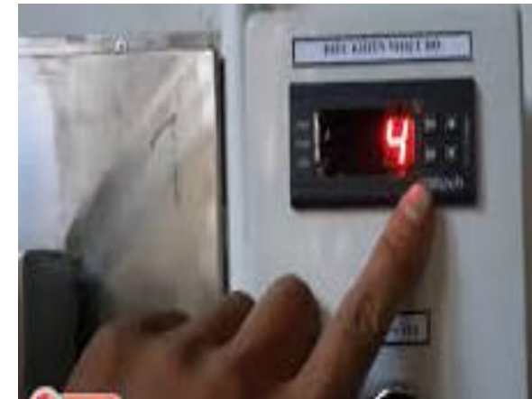
Cài đặt nhiệt độ kho lạnh