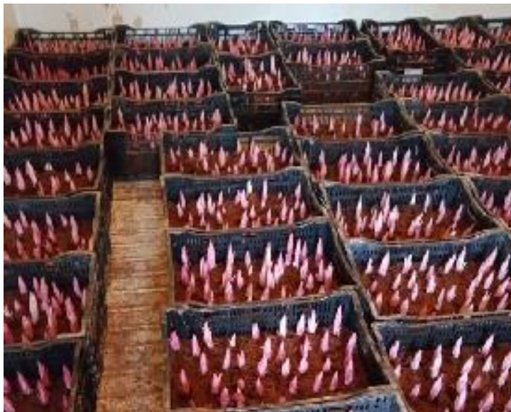
Củ hoa lily sau xử lý 5 ngày