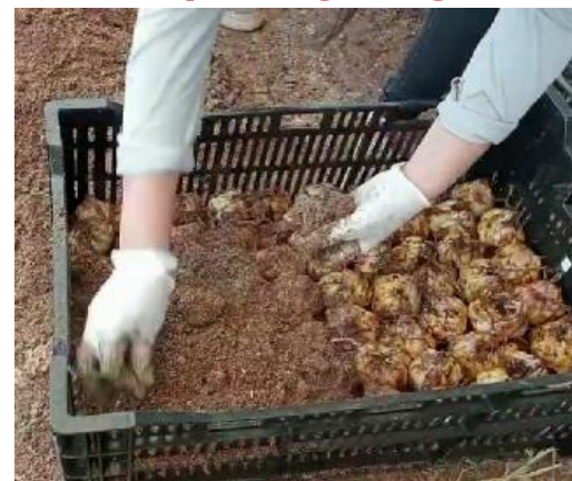
Phủ mụn dừa