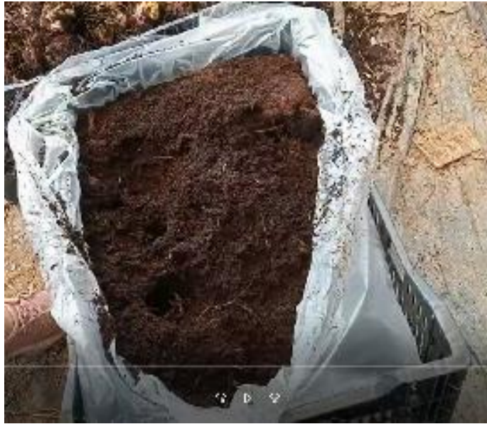
Mụn dừa trong sọt củ