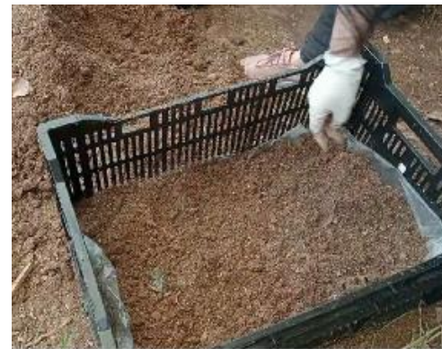
Cho mụn dừa vào sọt