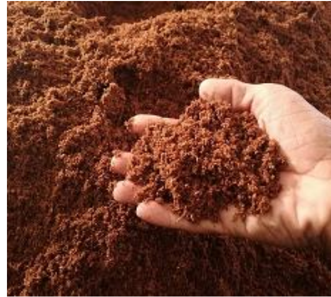
Mụn dừa tạt xử lý