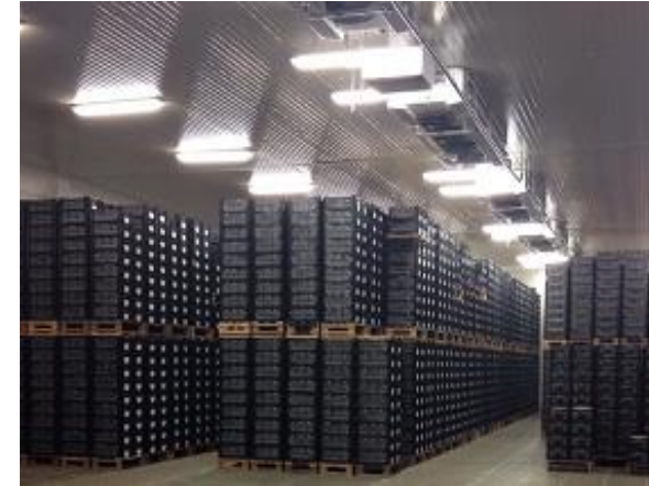
Xếp củ giống vào kho lạnh

Theo dõi, kiểm tra nhiệt độ kho lạnh và khắc phục nếu có sự cố