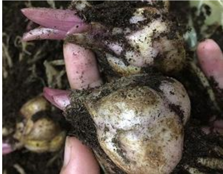
a. Rã đông củ