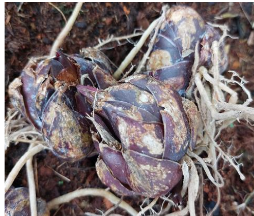
Củ hoa lily bị khô