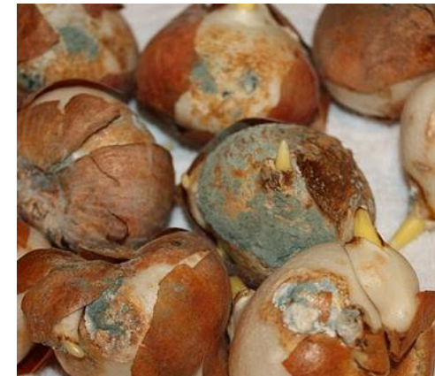
Củ hoa tulip bị nhiễm nấm