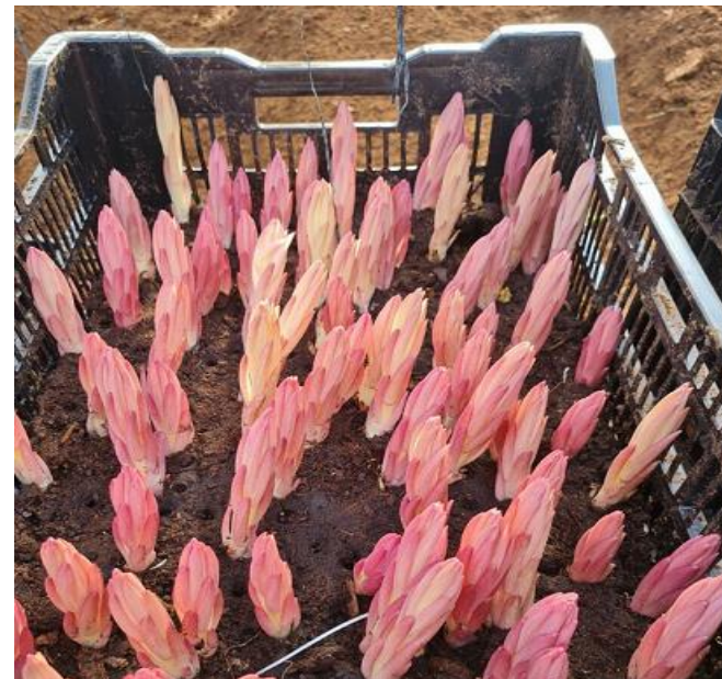
Củ hoa đem trồng