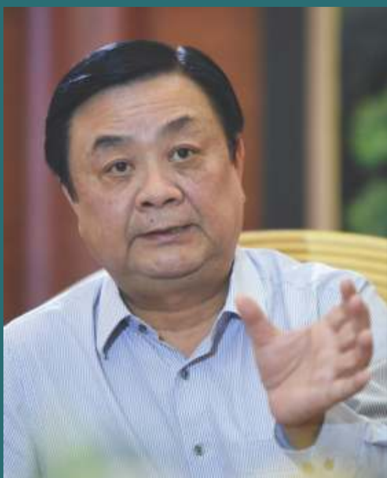
BỘ TRƯỞNG LÊ MINH HOAN